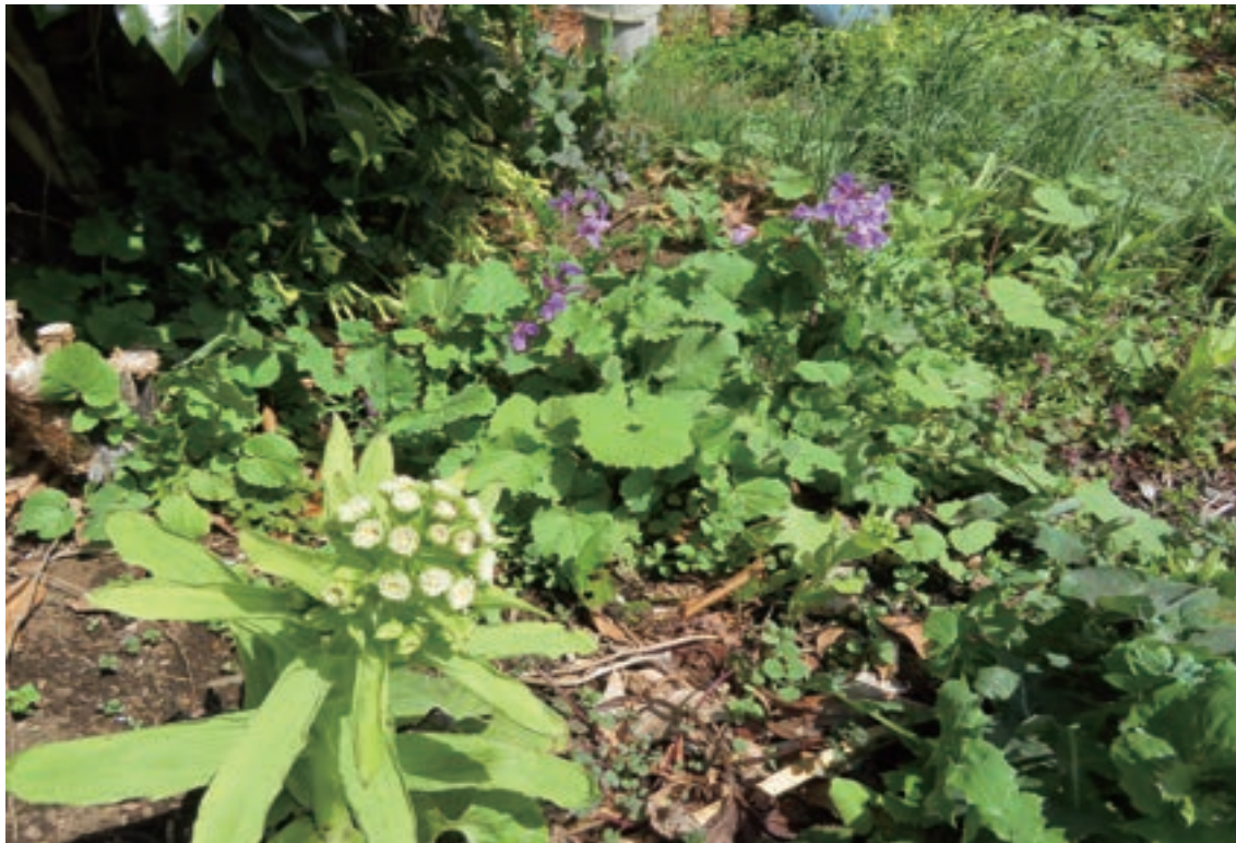
今年も春一番はふきのとうとハナダイコン