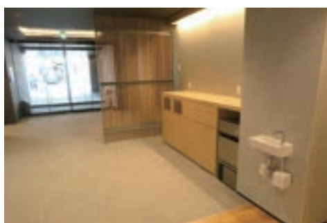
フリードリンクコーナー