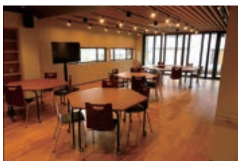
喫茶去7：交流・休憩スペース

小規模ではありますが園芸コーナーを設け、年間を通し様々な野菜や植物を育て、収穫・鑑賞できるよう計画しています。