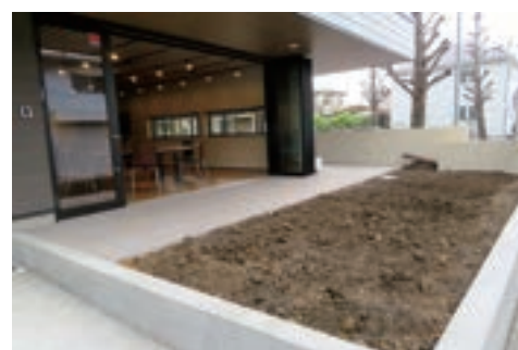
園芸コーナー（野菜・花畑）