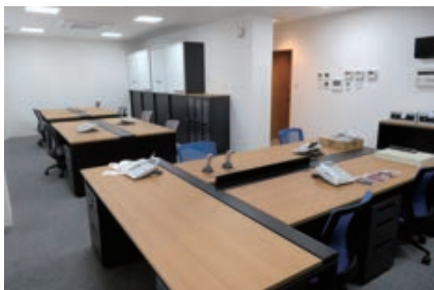
ヘルプーステーション千代田（1F）