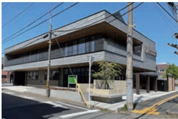
外観：休憩用にベンチ完備 シンボルツリーにはしだれ桜

平成29年より千代田7丁目の土地を購入し、色々な施設計画を立ててきましたが、ようやくこの4/11に建物・千代田7丁目センターが完成いたしました。