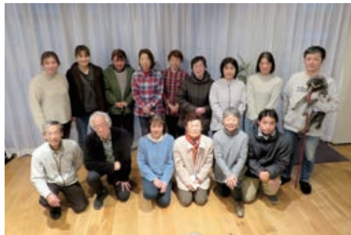
2024年12月ヘルパー定例会にて

昨年7月からオープンした千代田7丁目センターは、地域の皆様にも少しずつ認知度が広がってきているように思います。本年はさらに地域のニーズを吸収し、有意義な施設運営を進めていけるようスタッフ一同力を合わせて前進していきます。