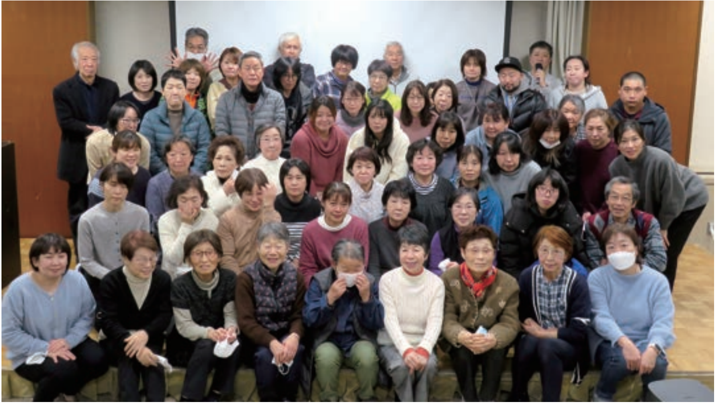
2023/12 ヘルパー定例会にて

あけましておめでとうございます。昨年はコロナの5類移行と大きな節目の年でしたがみなさんが安心して在宅生活を送れますよう引き続き感染症対策を継続しながら訪問させていただきます。